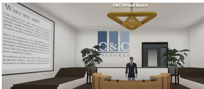
C&C en el Metaverso

En nuestro caso, la adopción del metaverso fomenta la innovación como parte de la cultura de la marca, ya que requiere que nuestro equipo piense en nuevas formas de utilizar la tecnología para resolver problemas legales y mejorar la prestación de servicios.