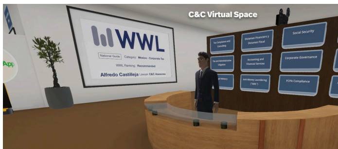
C&C en el Metaverso

En ese sentido, la capacitación para los colaboradores se desarrolla guiada por el equipo que diseñó el espacio. Se vuelve, en sí, una visita guiada para explorar previamente —ensayo y error— lo que genera un ciclo de aprendizaje y habitualidad.